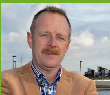
5 Ton Kempenaar Dronten